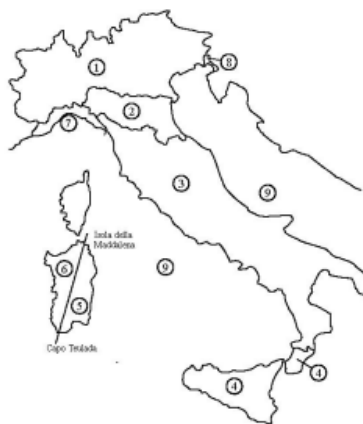
Fig. 3.3.1 - Mappa delle zone in cui è suddiviso il territorio italiano

L'area in cui viene eseguito l'intervento si trova in zona 7 , (si veda fig. 3.3.1 )