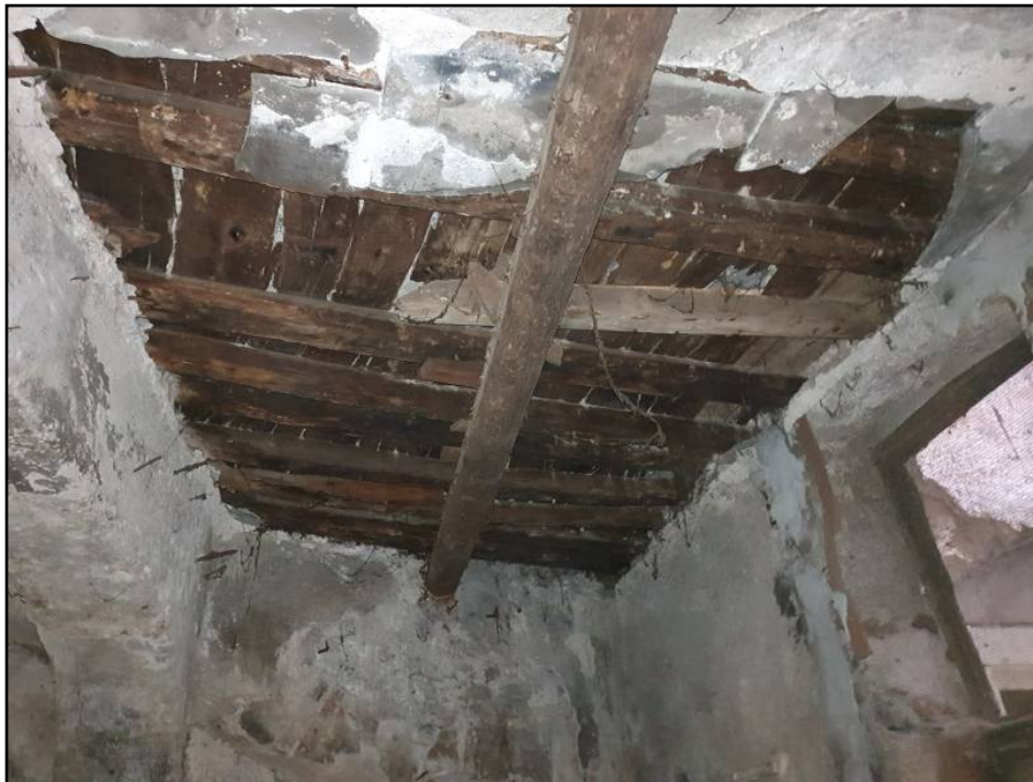
Porzione di solaio del piano primo.