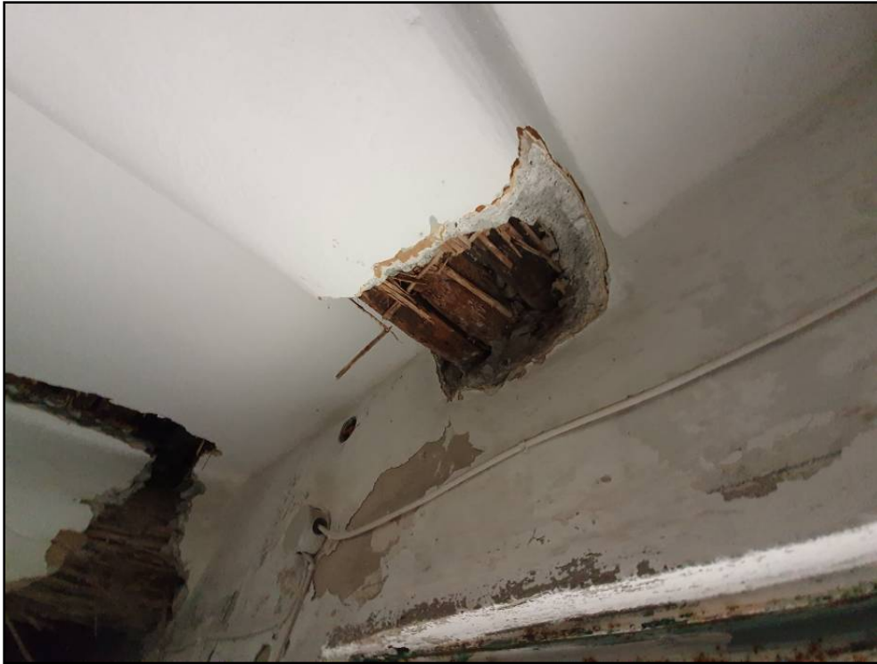
Trave principale primo solaio.

Nelle figure seguenti si riportano le foto delle indagini effettuate sui solai.