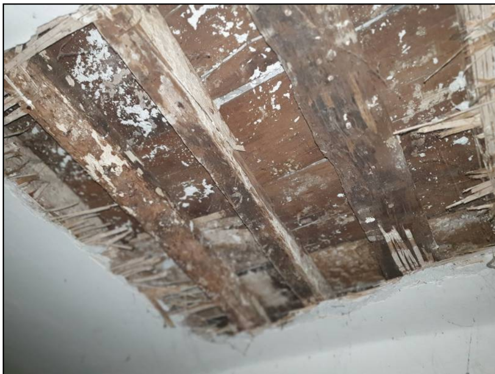
Solaio soppalco pino sottotetto.