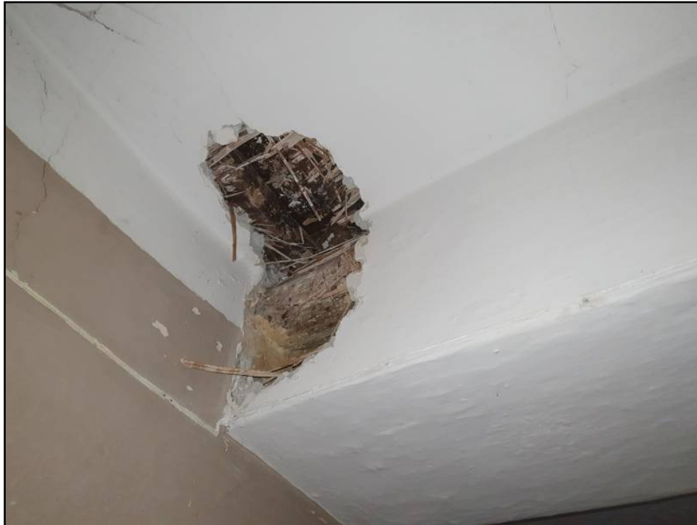
Trave principale terzo solaio.