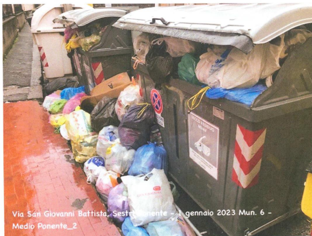
Via San Giovanni Battista, Sestri Ponente - 1 gennaio 2023 Mun. 6 - Medio Ponente_2