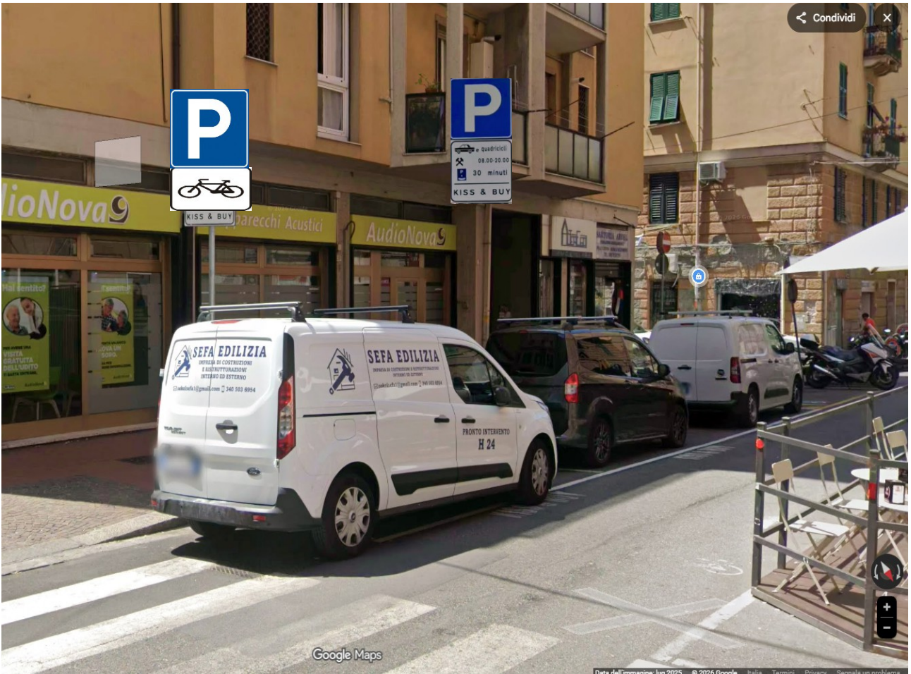
VIA DANTE GAETANO STORAGE