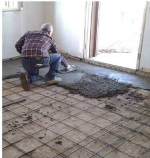
Rifacimento rivestimenti interni