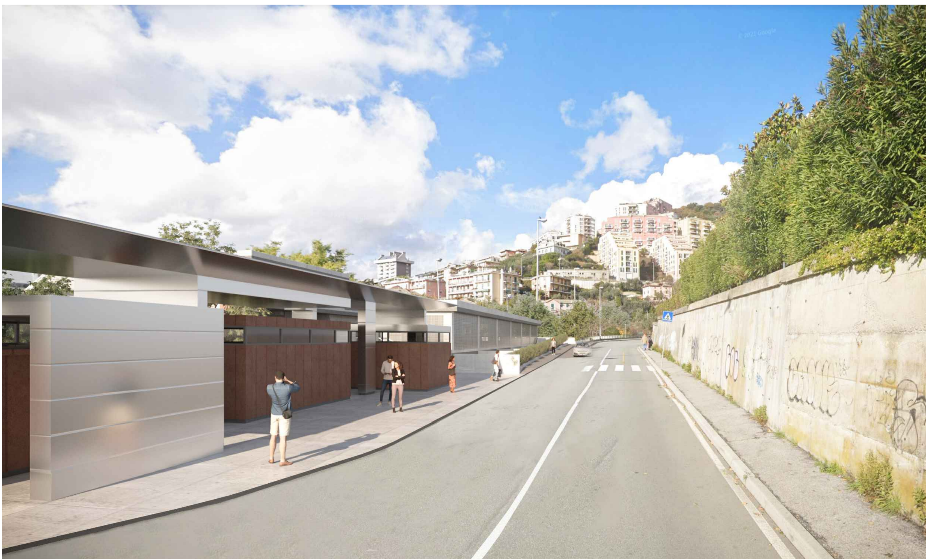
2 Vista dalla quota urbana