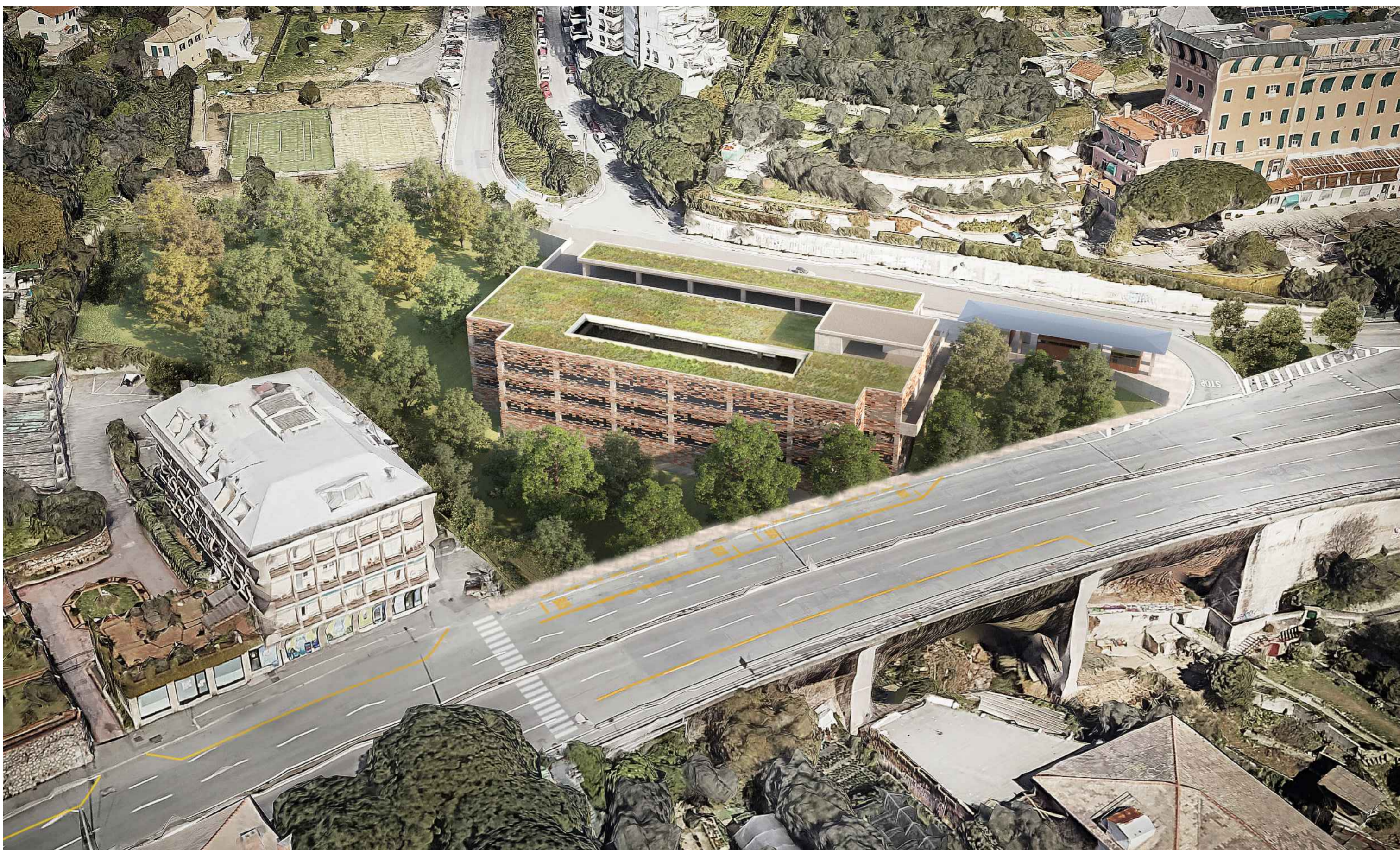
1 Vista Aerea