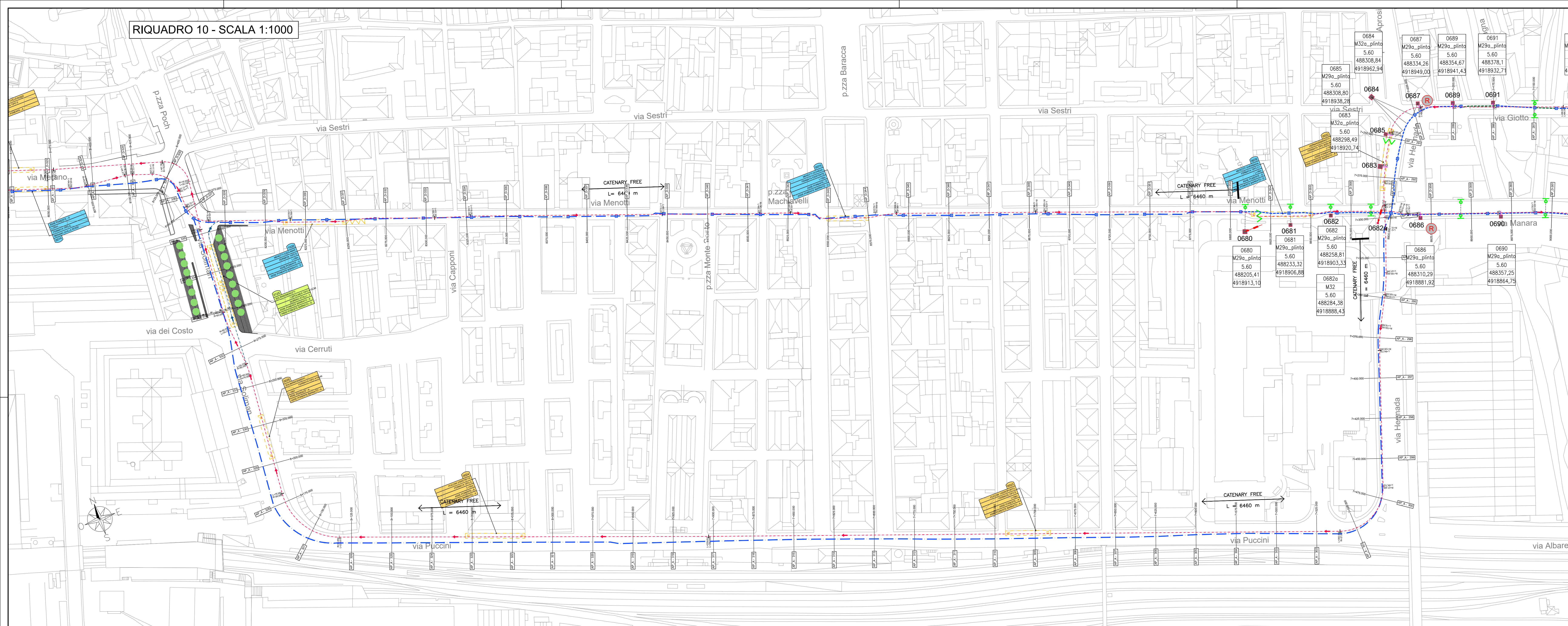
RIQUADRO 10 - SCALA 1:1000