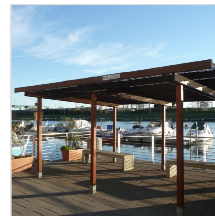
Passeggiata sul canale di calma