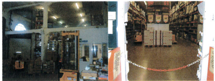
Viste interni (magazzino)