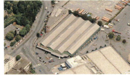
Vista aerea da Sud