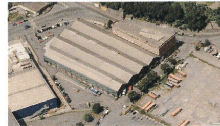
Vista aerea da Est