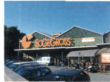
LE IMMAGINI RIPRODUCONO FEDELMENTE LO STATO ATTUALE