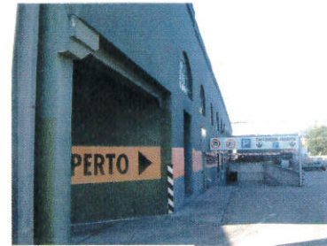
Vista del piazzale Est