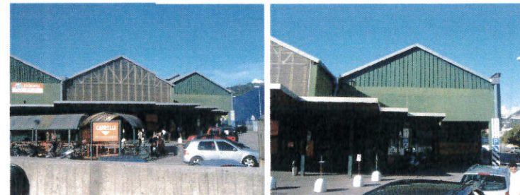
Viste del piazzale Sud