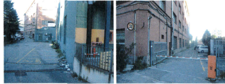
Vista del piazzale Ovest (da sud) Vista del piazzale Ovest (da nord)