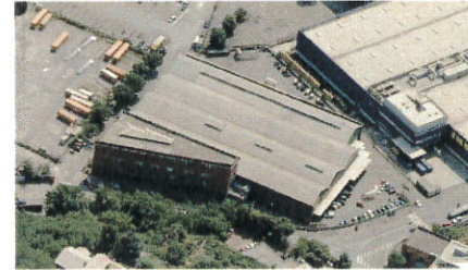
Vista aerea da Ovest