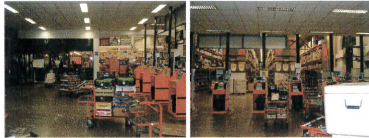
Viste interni (casse)