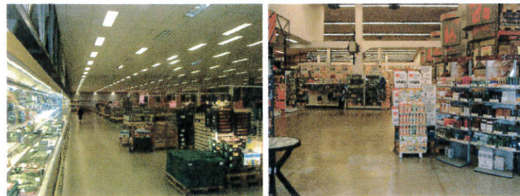
Viste interni (vendita)