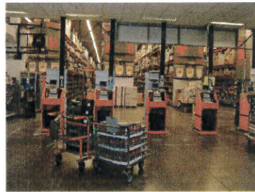
LE IMMAGINI RIPRODUCONO FEDELMENTE LO STATO ATTUALE