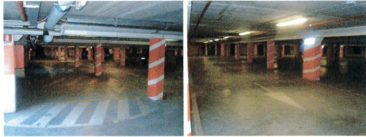
Vista interni (autorimessa)