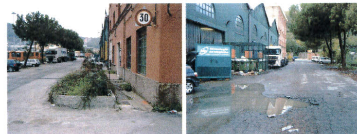
Viste del piazzale Nord