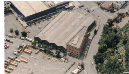
Vista aerea da Nord