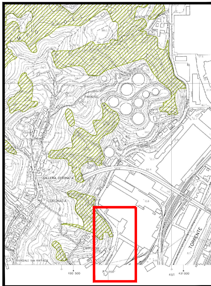
STRALCIO P.U.C. ADOTTATO CON D.C.C. n° 8 DEL 04.03.2015 - TAVOLA 27 Piano Comunale dei beni paesaggistici soggetti a tutela